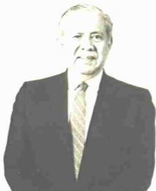
PLAT 7 Tengku Tan Sri Dato' Seri Ahmad Rithauddeen bin Tengku Ismail, seorang lagi kerabat Istana Kelantan yang bergiat cergas dalam politik UMNO Kelantan.